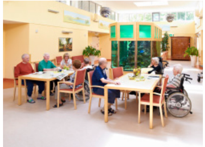
Bei uns sind Sie stets in bester Gesellschaft.

Eine moderne Physikalische Abteilung sowie unsere Tagesklinik sind dem Gebäude angegliedert, ebenso ein Behandlungsraum für die medizinische Fußpflege. Das Gebäude besitzt eine große Sonnenterrasse, die an schönen Tagen zum Verweilen einlädt.