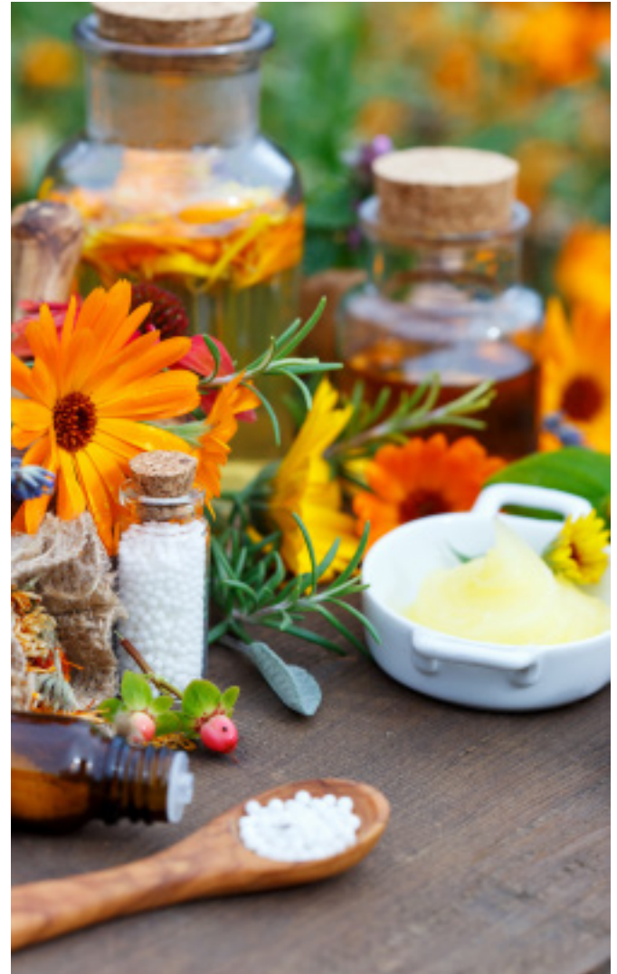
Naturheilkunde hilft Ihnen, sich selbst zu helfen.

Das gilt natürlich auch, und besonders, für den hochbetagten Menschen. Der Körper kann hierdurch Krankheiten besser widerstehen bzw. bestehende Krankheiten können hierdurch gelindert, unter Umständen sogar geheilt werden. Bei vielen chronischen Erkrankungen gelingt es, chemische Medikamente einzusparen. Am Beginn der Therapie steht ein persönliches Gespräch mit ausführlicher ärztlicher Untersuchung, um den Fahrplan Ihrer Behandlung gemeinsam mit Ihnen festzulegen und Ihre offenen Fragen zu klären. Am Ende Ihres Aufenthaltes bieten wir Ihnen selbstverständlich gerne ein Abschlussgespräch an (Angehörige mögen dies bitte über das Sekretariat terminieren), um über Ihren Werdegang bei uns abschließend zu besprechen, die Weiterführung der Medikation festzulegen und über die Möglichkeit der Fortführung der Naturheilkunde im häuslichen Bereich zu informieren.