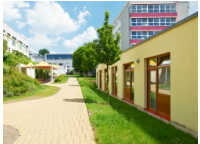
Unsere Anlage mit angenehmer Atmosphäre.